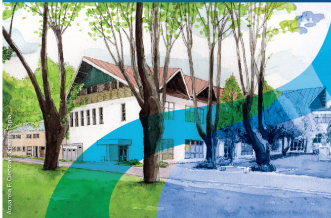
Acurarria F. Ciencias - Centro Talca

Pontificia Universidad Católica de Chile, Campus Villarrica