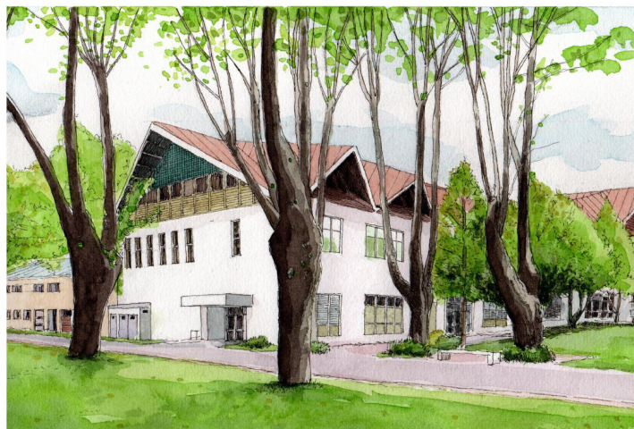
Facultad de Ciencias.

Formulario disponible en: https://ciencias.ubiobio.cl/jmzs/inscripciones/